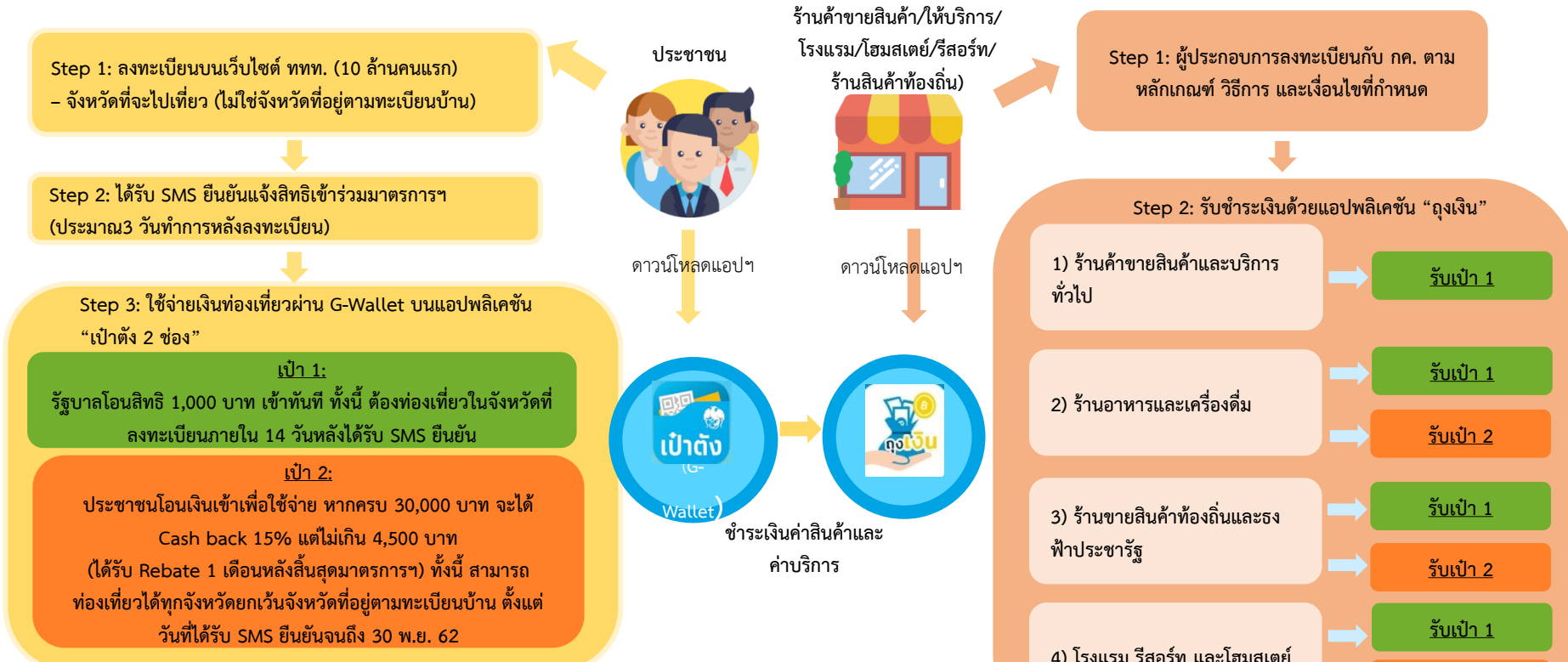
ตารางระยะเวลาการดำเนินงาน